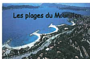
Les plages du Mourillon