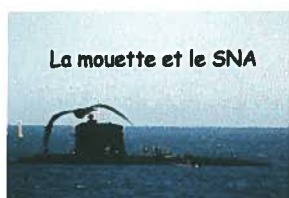
La mouette et le SNA