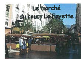
Le marché du cours La Fayette