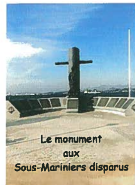
Le monument aux Sous-Mariniers disparus