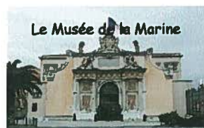
Le Musée de la Marine