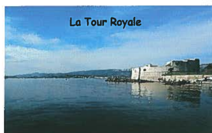
La Tour Royale