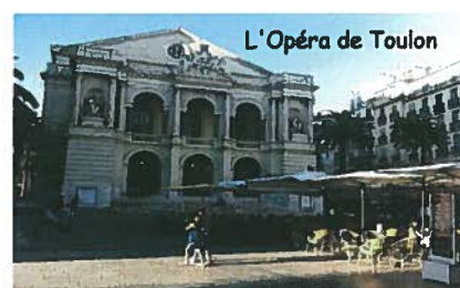
L'Opéra de Toulon