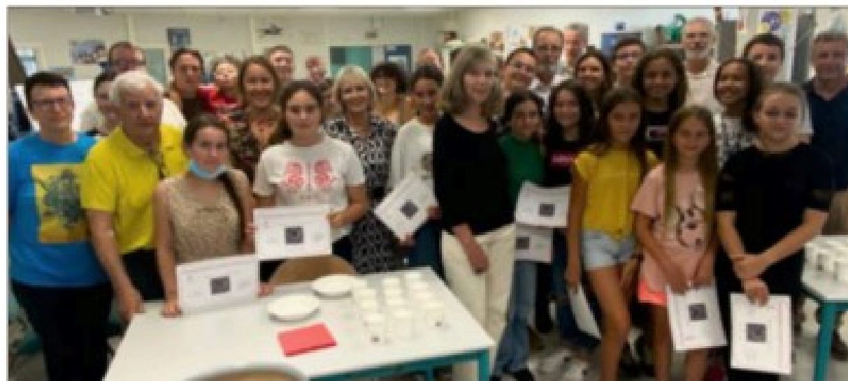
Ils étaient une trentaine à avoir eu le désir de participer au concours national de la SMLH « Dessine-moi la Légion d'honneur ».